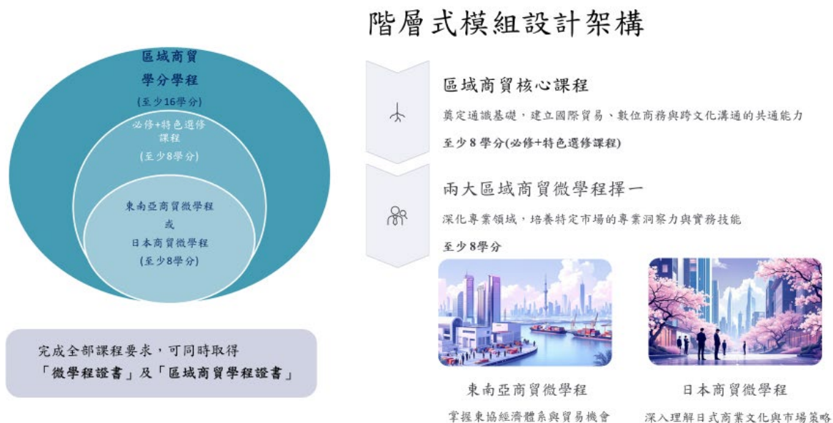
圖 1 區域商貿學分學程課程架構示意圖

學程招收對象為本校二至四年級學生。內容完整涵蓋區域商貿之學習，本學程課程修習完成必修課程(2 學分)及特色選修課程(至少 6 學分)，以此建立國際貿易、數位商務與跨文化溝通的共通基礎(廣度)；同時尚需擇一搭配一微學程(東南亞商貿微學程或日本商貿微學程)，完成該微學程所要求之學分數(至少 8 學分)，以培養特定市場的專業洞察力(深度)，共計取得至少 16 學分，則可取得「微學程證書」及「區域商貿學程證書」。