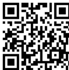
教師報名 QR code